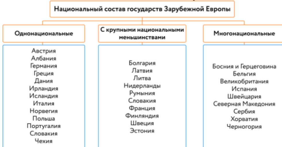
Национальный состав стран Зарубежной Европы

В Зарубежной Европе проживает более 60 народов, большинство относится к индоевропейской языковой семье. Подавляющее число стран однопациональные.